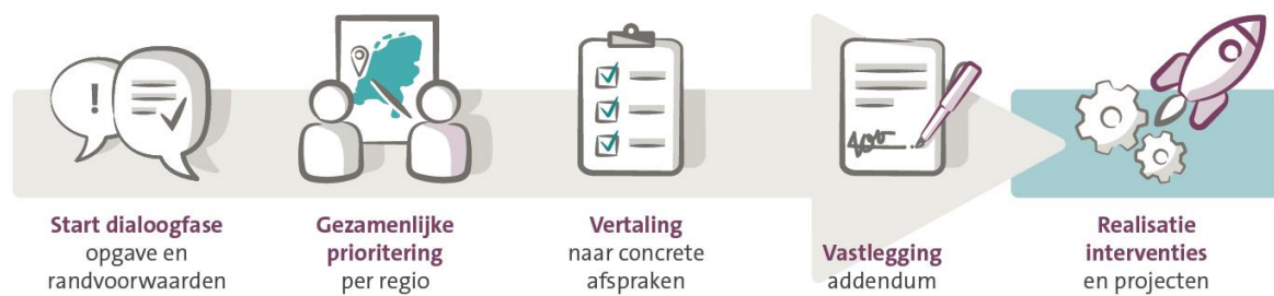
Figuur 1: Regiotafel – werkwijze in fasen